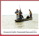
ประมงหลายลำรวมกัน ห้ามทะเลมุมนหลายลำเข้า