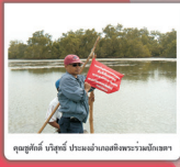
จุดสุดท้าย บัญชี ประเมินปริมาณสัตว์ประมงในเรือ