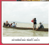
ถ่ายเอกสารบันทึก บัญชี เสนาฯ

กลุ่มงานวิจัยระบบและการจัดการเพาะเลี้ยงสัตว์น้ำชายฝั่ง สถาบันวิจัยการเพาะเลี้ยงสัตว์น้ำชายฝั่ง สำนักวิจัยและพัฒนาประมงชายฝั่ง กรมประมง ได้ดำเนินงานโครงการฟื้นฟูทรัพยากรประมงในทะเลสาบสงขลา ปี 2548 โดยมีกิจกรรมการอบรมประมงอาสา เพื่อพัฒนาพ่ามทะเลโดยชุมชนมีส่วนร่วม จำนวน 5 แห่ง โดย ได้แก่