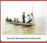
มีหลายลำ ติดแหงนห้ามทะเลมุมนหลายลำ