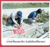
เจ้าหน้าที่ของสถานีฯ จับไม้กั้นโข่ที่ปลายนา