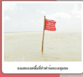
ธงแดงแสดงพื้นที่ห้ามทะเลมุมน