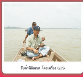
จับปลาใช้ถุง โดยถือ GPS