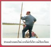
ประมงจับปลา โข่ มาหาไม้กั้นโข่ และใช้ตะลอม