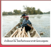
ห้ามเรือเข้าได้ โดยเรือประมงหลายลำทะเลมุมน