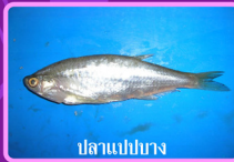
ปลาแปบยาง