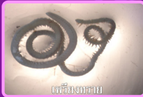
แพลงก์ตอน