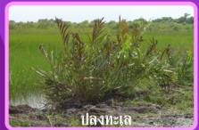
ปลิงทะเล