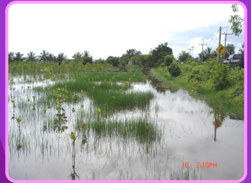
การสำรวจพื้นที่โครงการฯ ก่อนดำเนินการวิจัย