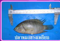
ปลาหมอช้างเทียม